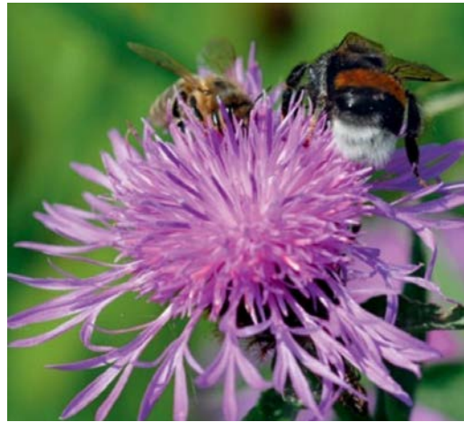
Honingbij naast hommelmel op knoopkruid